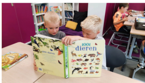
Mandjeslezen in groep 4