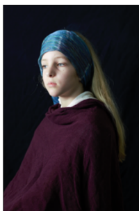
Kunst tijdens het cultuurmenu in groep 7/8